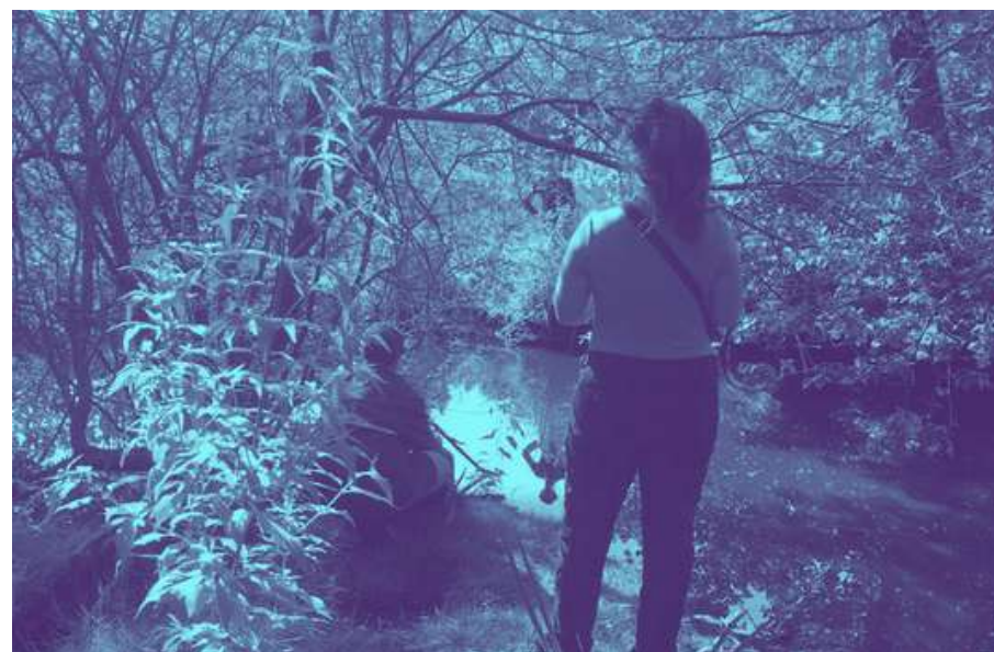
Arpenteage dans le nord du Marais - juillet 2023