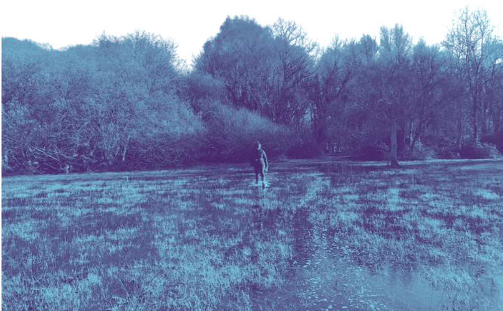
Arpentage à Herbignac, Marais de Brière - Mars 2023