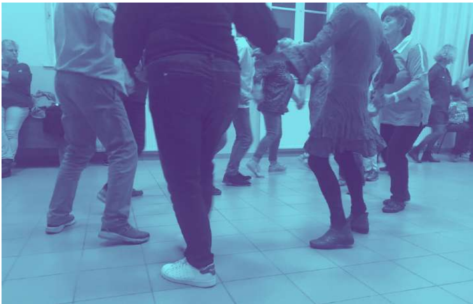
Atelier danse bretonne avec le COUPIL - La Chapelle-des-Marais - mai 2023

Au vu de cet enjeu, comment œuvrer collectivement à la bonne santé du marais pour que ce rôle de captation de carbone perdure ?