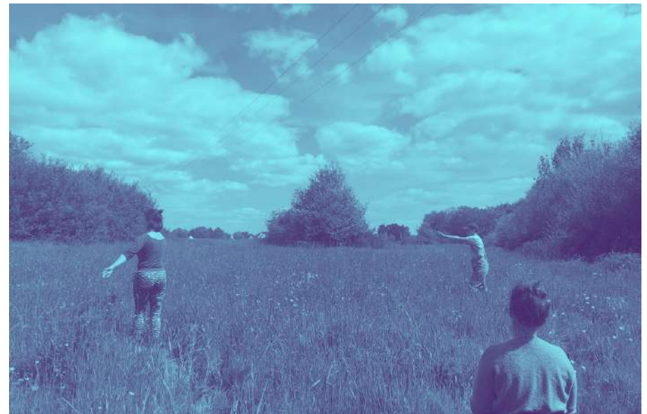
"Lecture dansée de paysage - Répétition et improvisation - Mai 2023